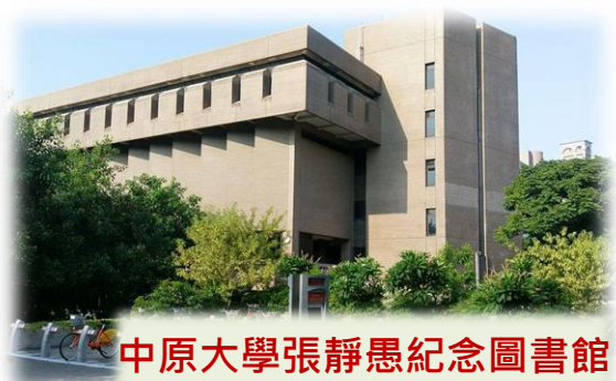
中原大學張靜愚紀念圖書館

(3)家長接送者：可至本校網頁參考 https://www.cycu.edu.tw/map.html