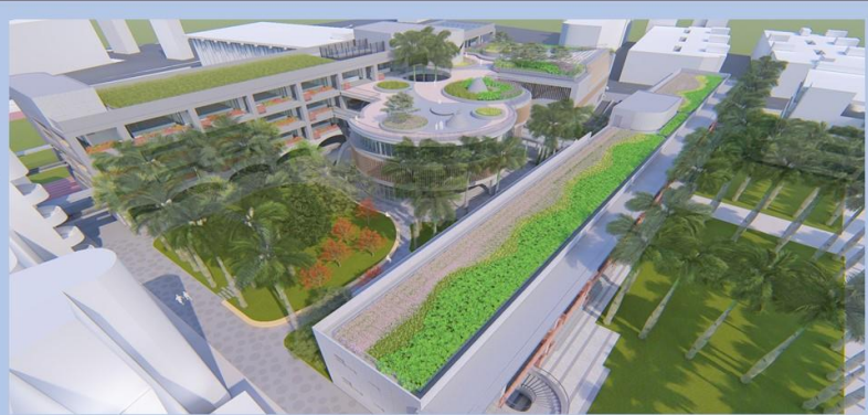
綜合大樓暨附設地下停車場新建工程